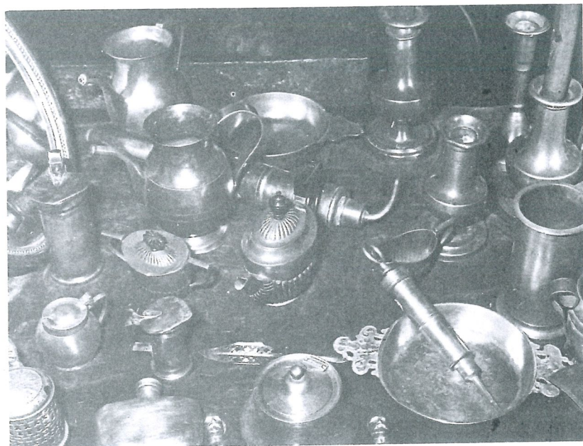
▶ Ensemble d'objets du XVII e au XIX e s., de 140 F à 1.800 F chez M. J.-L. Armangaud à Royan.