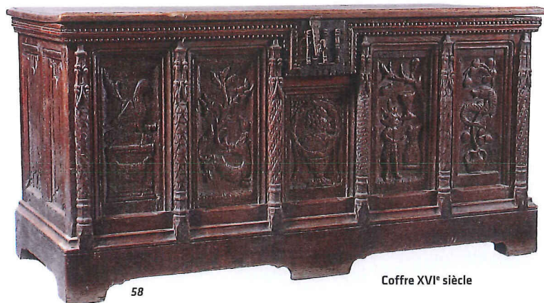
Coffre XVI e siècle

Le jeune apôtre - le préféré du Christ - est vêtu d'un long manteau à large col, aux plis profonds et parallèles. Il tourne son regard vers le Crucifié, un regard presque innocent, où ne se lit ni tristesse, ni misérabilisme, ce qui est assez original dans ce type de représentation. Il tient dans la main gauche les emblèmes de la rédaction de son futur évangile : un encrier, un réservoir à calames, et un livre qui témoignera de la Passion de son Seigneur.