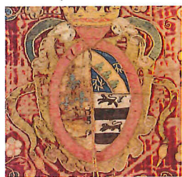
Portière aux armes d'alliances

Plaque d'albâtre sculpté en haut-relief, associant d'une part la Nativité et l'adoration de Jésus enfant entouré de Marie, Joseph, de trois anges, avec la représentation traditionnelle de l'étable dans un environnement architectural ; et