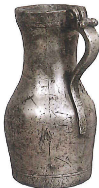
Pichet d'étain, vers 1500