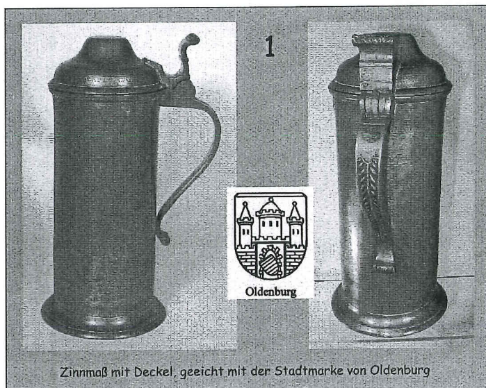
Zinnmaß mit Deckel, geeicht mit der Stadtmarke von Oldenburg

Op 20 oktober 2006 brengt Dirk Schmitz zijn tweede CD uit, deze keer over Duitse 'natte' inhoudsmaten. In ongeveer 150 afbeeldingen worden ze getoond, voorzien van bijschriften en inzetjes met stadsmerken, merken van tinnegieters, ijkmerken, enz. De helft van het getoonde materiaal betreft tinnen maten; de rest is van koper, messing, blik, steengoed, porselein en glas. Enkele voorbeelden staan hiernaast afgebeeld.