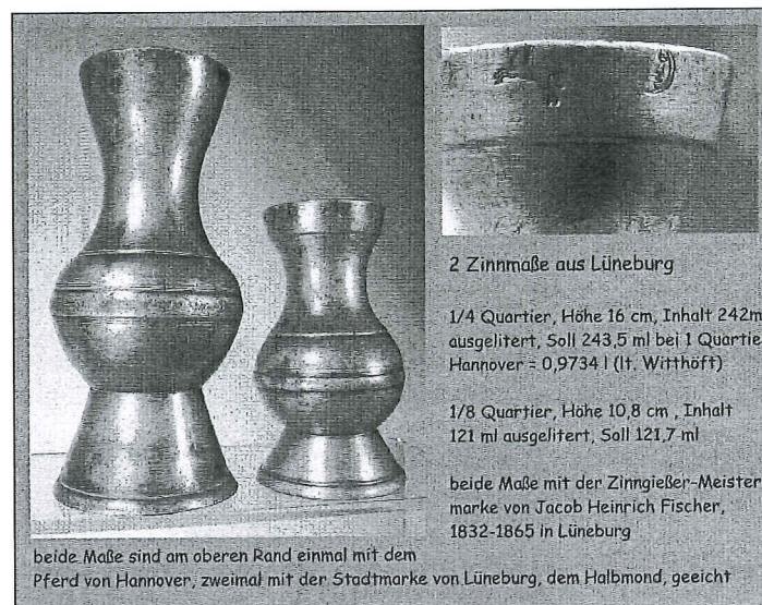
2 Zinnmaße aus Lüneburg

Eveneens voor 7 euro is nog beschikbaar de eerste CD, zoals aangekondigd op pp. 3134 en 3173. Deze CD bevat 115 afbeeldingen van gewichten, weegschalen, inhouds- en lengtematen uit Noord-Duitsland, met de nadruk op het koninkrijk Hannover. ♦