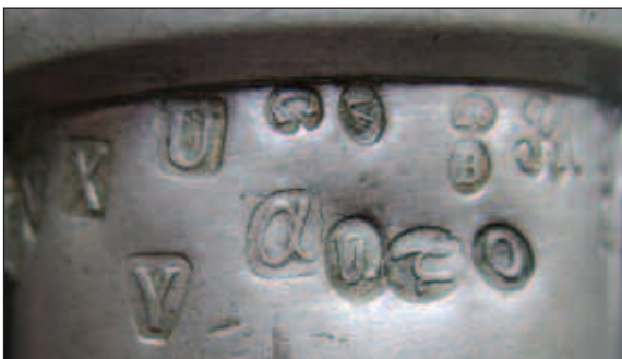
Afb. 8 Het Belgische kantoormerk 14 en de jaarletter C voor 1833.

heeft Philippeville, omdat het maar een dependance was, na deze hernummering geen eigen kantoormerk meer gekregen.