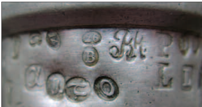
Afb. 7 Het Belgische kantoormerk 26 en de Belgische jaarletter B voor 1832