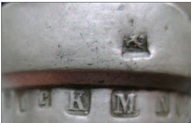
Afb. 3 Het ijkmerk leeuw in vierkant stempelveld.