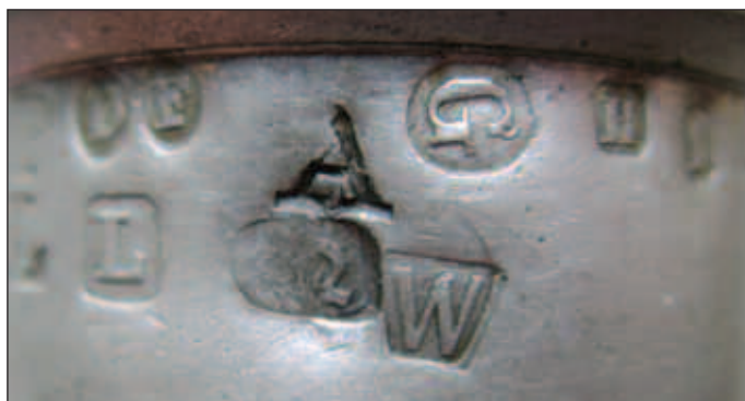
Afb. 6 De losse letter A, het Belgische kantoormerk 12 of 22 en de Belgische jaarletter W voor 1853.

Indien we de kantoormerken op deze maat indelen [1; tabel 2], dan ontstaat er een probleem. Volgens de tabel waren er anno 1832-1833 slechts 25 Belgische ijkkantoren, terwijl er, naar nu blijkt, in 1832 nog een 26e ijkkantoor moet zijn geweest. Indien we echter in het oog houden dat Philippeville in 1829 en 1830, ondanks dat dit een dependance van Namen was, toch eigen merken heeft gevoerd [1], en we houden in het oog dat er in de provincie Namen in 1831 een losse letter A als jaarmerk is gebruikt [2], dan is het raadsel als volgt te verklaren (tabel 1):