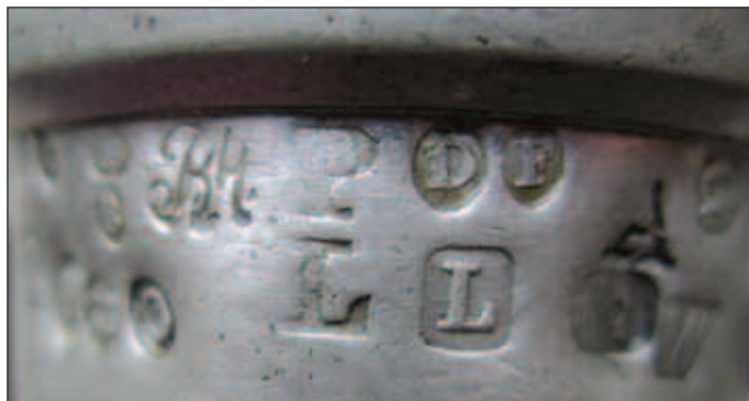
Afb. 5 Het jaarmerk P boven L, en de letters BH of JBH.