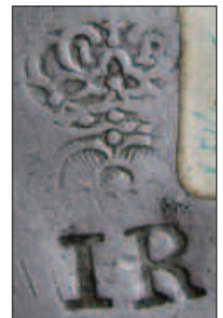
Afb. 2 Het gietersmerk met de initialen IR.