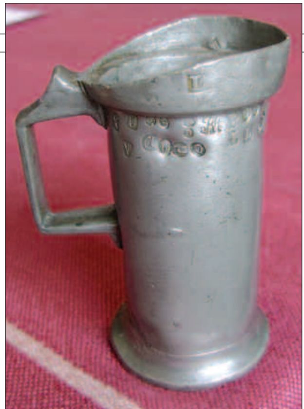
Afb. 1 Tinnen maat uit Luik.

Verder zien we op deze maat nog een losse letter A, met vlak daarnaast het Belgische kantoormerk 12 of 22 (is niet meer goed te zien) en de Belgische letter W van 1853 (afb. 6), de Belgische letter B (1832) met het kantoormerk 26 (afb. 7) en de Belgische letter C (1833) met het kantoormerk 14 (Dinant, afb. 8). Verder nog een heleboel andere Belgische ijkmerken.