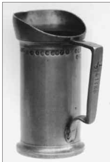
Afb. 1 en 2 Tinnen maat uit 1830 van Ten Klooster (Gz) te Zwolle.