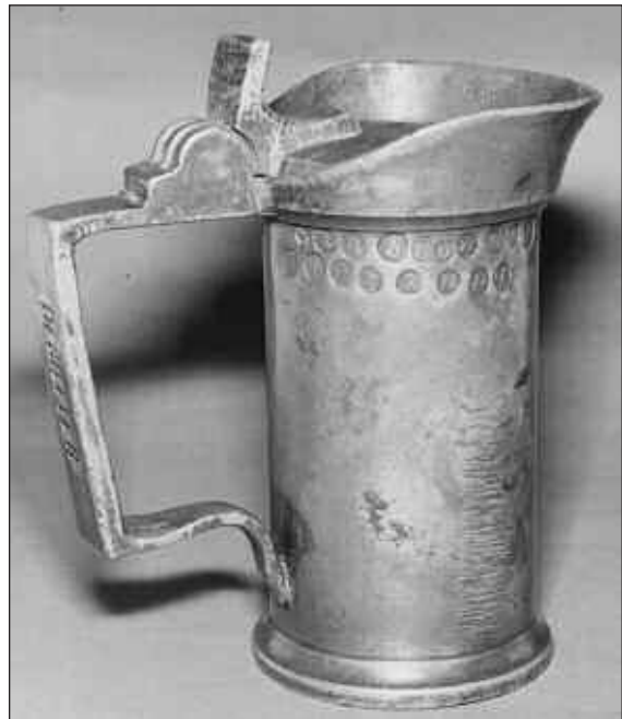
Afb. 1 Zwolse tinnen klepmaat van een DECILITER uit 1863.

Bij dichting van het gat in de bodem van het onderhavige klepmaatje, blijkt een stuk tin te zijn gebruikt van een oud 18e eeuws tinnen voorwerp. In de bodem is een ronde plak (Ø ca. 25 mm, afb. 4)