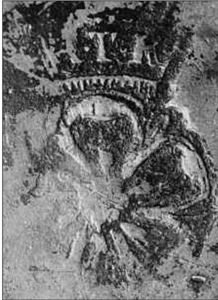
Afb. 3 Gietersmerk van de Zwolse tinnegieter Arend ten Klooster

Het viermerk vertoont meestal de hierna beschreven volgorde: in het eerste (linker) schildje staan de initialen van de gieter. Soms komt voor dat de naam is vermeld. Het eerste schildje is dus een meesterteken. Het tweede schildje draagt een engel en is het eigenlijke kwaliteitsmerk. Het derde schildje beeldt de Hollandse leeuw af. Het vierde schildje vertoont een persoonlijk merk of het wapen van de gieter of het wapen van de stad waar hij werkzaam was. Vaak staat boven het viermerk een gekroonde X, hetgeen ook een merk voor goede kwaliteit tin betekent [2]. Ter illustratie volgt hieronder zo'n viermerk (afb. 5). In dit geval betreft het het merk van Arent Jan Coenen te Amsterdam (geboren in ca. 1709, overleden in 1768) [3].