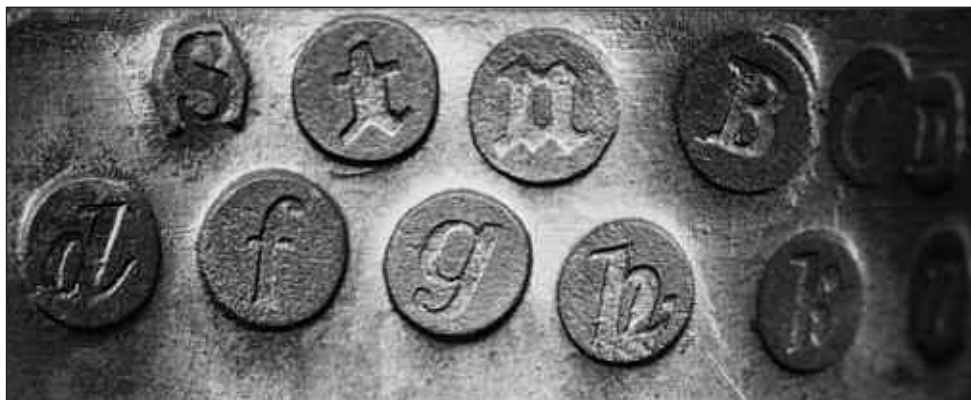
Afb. 2 Het particuliere merkteken van de Zwolse arrondissementssijker E.G. Staal sr.

zichtbaar met de middelste schildjes van een zogenaamd viermerk. Dit in Nederland in het begin van de 18e eeuw in gebruik genomen merk was net als het engelmek, een merkteken voor de beste kwaliteit tin, het zogeheten Engelse bloktin.