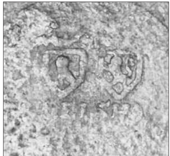
Afb. 4 De 'ziel' in de binnenzijde van de maat, met het restant van een viermerk.