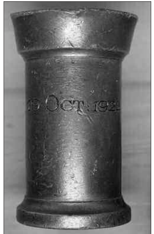
Afb. 2 Gravering op het tinnen maatje.

[1] G.P.M. Schunselaar, (2000). Messing melkmaat als huwelijkskado, in: 'METEN & WEGEN', p. 2671.