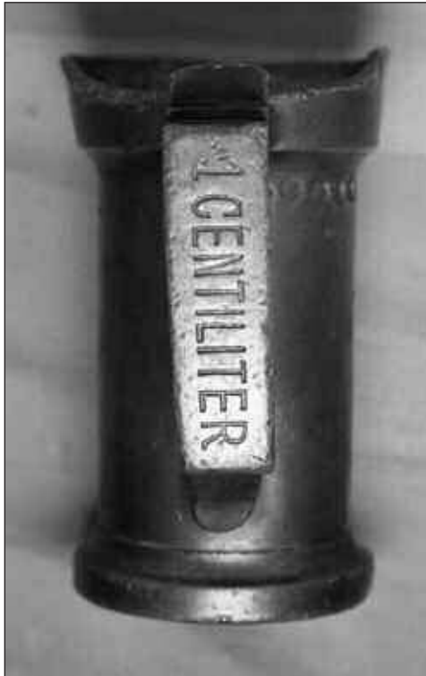
Afb. 1 Tinnen maatje van 1 CENTILITER.

In ons lijfblad beschrijft de heer G.P.M. Schunselaar in december 2000 een mooie messing melkmaat van ½ LITER met een zeer fraaie gravering van namen en datum, verband houdende met een koperen huwelijk [1].