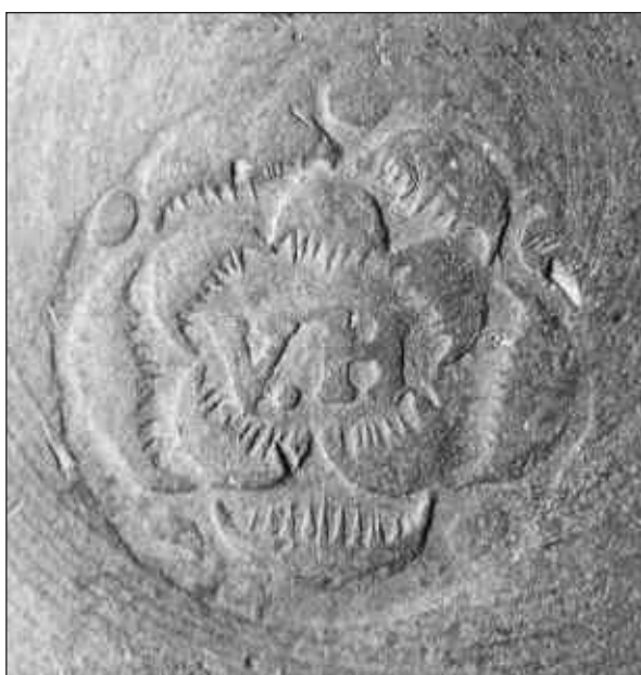
Afb. 1 Tinnen maat van 2 VINGERHOED:

Afb. 1a: het ijkersmerk aan de binnenkant van de schenkrand;