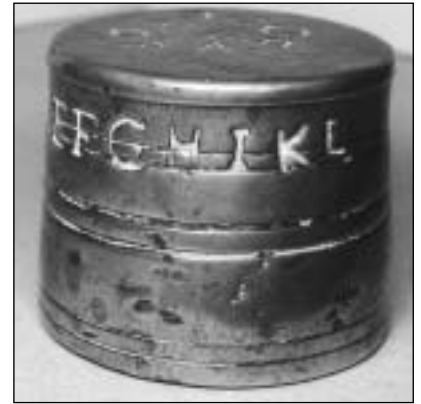
Afb. 7a-c Blokgewicht van 1 pond, geijkt in Hoorn, 1729, 1737, 1741, 1781-1819.