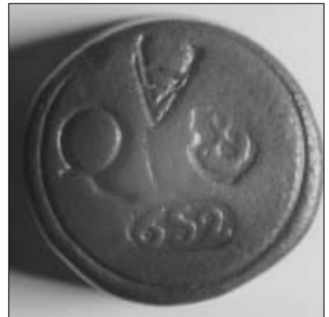
Afb. 4 Bovenzijde van een blokgewicht uit Hoorn met jaarletter Q (omstreeks 1650), jaartal 1652 en jaarletter A van 1781.