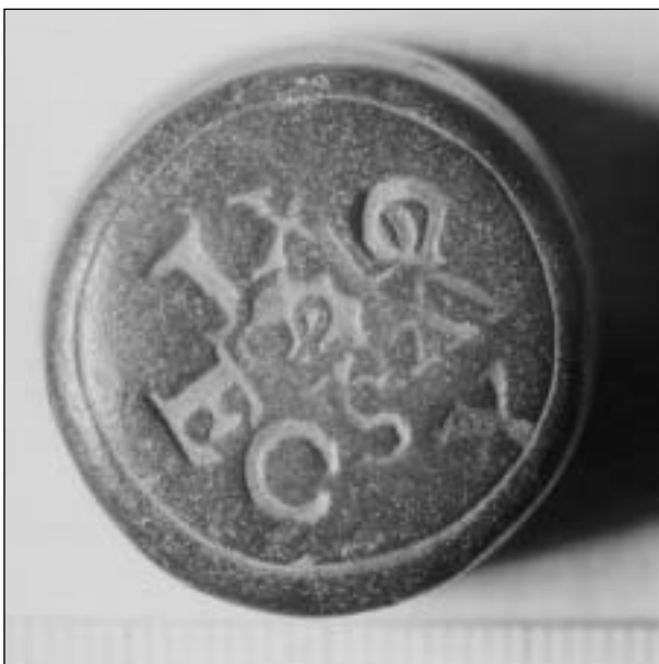
Afb. 5 Bovenzijde van een blokgewicht uit Hoorn met jaarletters tussen 1656 en 1701.