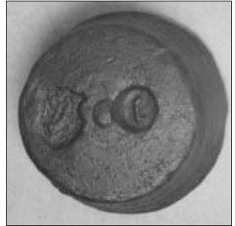
Afb. 3 Loden gewicht van een kwart pond, gegoten in een kom van een sluitgewicht. Gemerkt met hoorn in schild en een kleine gotische jaarletter c. Massa 117,3 g.