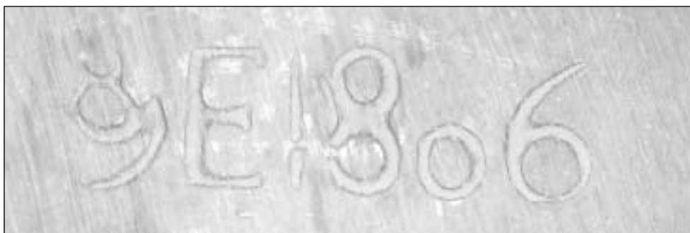
Afb. 15 IJkmerken Hoorn, jaarletter E en jaartal 1806 binnen in de bodem van een eiken spanen maat.