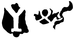
Afb. 10a/b Twee messing inhoudsmaten, gegoten, met ingezette latoenkoperen bodem. Het grote exemplaar is links van het handvat gemerkt met een jaarletter Y en hoorn; inhoud bepaald door waterweging op 714,5 ml (1 pint voor wijn en gedestilleerd). Het kleine exemplaar is ongemerkt en meet 352,5 ml.