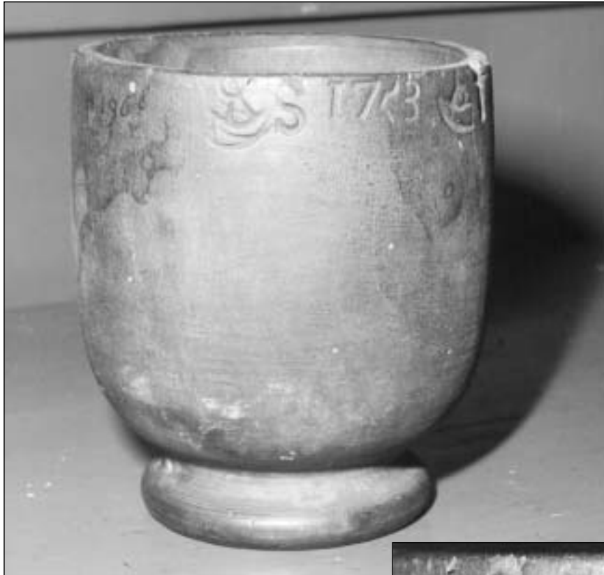
Afb. 13a/b Gedraaid houten maat, kaaskop-model. Langs de bovenrand geijkt hoorn S 1753, hoorn T 1757, hoorn D 1793.