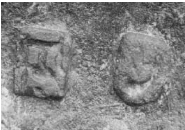
Afb. 2 Loden gewicht van een kwart pond, gemerkt met hoorn in schildje en jaarletter E in rechthoek. Massa 119,53 g.