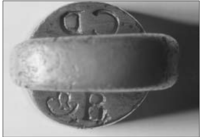
Afb. 8a/b Krukgewichtje van een achtste pond uit Hoorn met jaarletters B, C, D en L van 1785, 1789, 1793 en 1819.