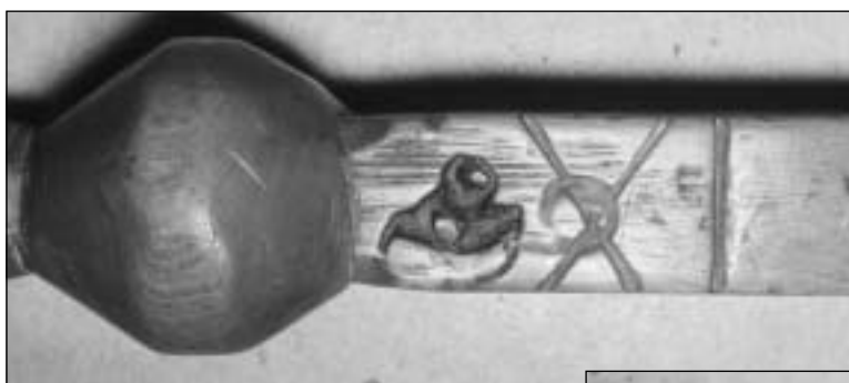
Afb. 12a/b Ijkmerken van Hoorn van 1737, jaarletter X van 1769 en bijbehorend jaartal. Bij het begin van de schaalverdeling het merk hoorn en jaarletter O van 1737.