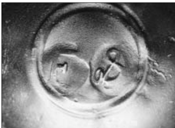
Afb. 9a/b Gres kruik met zoutglazuur bedekt. Pegel rechts in de hals. Voorzien van een tinnen deksel met tweekakig scharnier. Op het deksel jaarletter F van 1615 en het merk van Hoorn. De pegel is niet gemerkt. Op de buik van de kruik is driemaal hetzelfde medaillon aangebracht: IAN ALLERSG boven een eenhoorn die het wapen van Hoorn vasthoudt. Hoogte incl. deksel 210 mm.