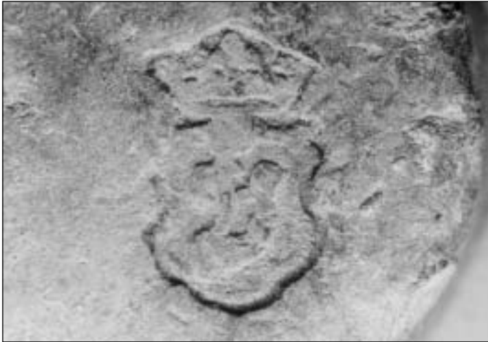
Afb. 1 Loden gewicht van een kwart pond, gegoten in een kom van een sluitgewicht. Slechts gemerkt met een gekroond schild met hoorn. Massa 119,6 g.