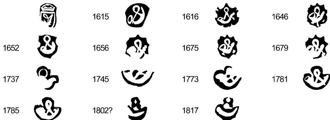
Tabel B Enkele variaties van het stadsmerk van Hoorn tussen eind 16e eeuw en 1817, afgeslagen op metalen voorwerpen (lood, messing en tin).

men, begin ik wat te twijfelen aan de juistheid van het middenstreepje en probeer ik een lengte te vinden die het beste aansluit bij de meeste streepjes.