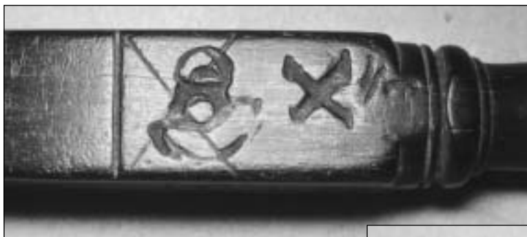
Afb. 11a/b Enkele ijkmerken op een ebbehouten ellestok, geijkt tussen 1660 en 1712: jaarletter X (1679) met hoorn bij het begin van de schaalverdeling, jaartal 1712 + bijbehorende jaarletter H.