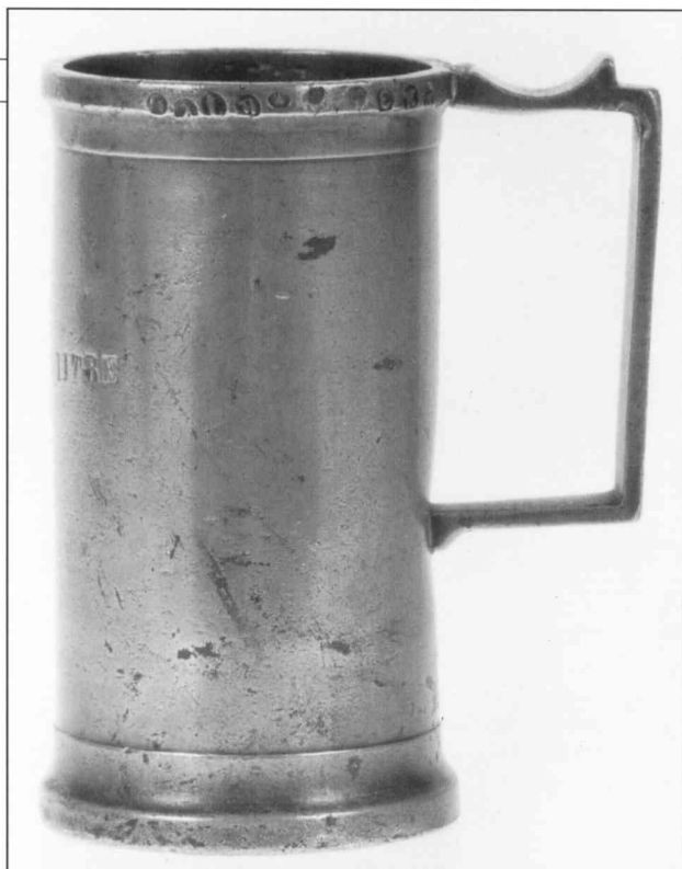
Afb. 1a DEMI LITRE, zonder schenkrand. Gegoten door Bartholomeus Cyprianus Fornara te Geel (1800–1880). Afmetingen: hoogte 8,4 cm; Ø voet 4,8 cm. Langs de bovenrand gemerkt met een kroontje en als eerste ijk \alpha boven 10 (= Mechelen, 1875). Geijkt door Jean Baptiste François Genevais (benoemd bij KOB van 8 juni 1870, Staatsblad van 12 juni 1870). Afgekeurd met RA in een driehoek. Zie ook: Ijking der maten en gewichten gedurende het jaar 1875 , in het Belgisch Staatsblad, 44e jaar, nr. 318 van 14 november 1874, p. 3456. Er is een vergelijkbare maat uit 1872 bekend van LITRE, met de afmetingen: hoogte 17,7 cm; Ø voet 9,7 cm.