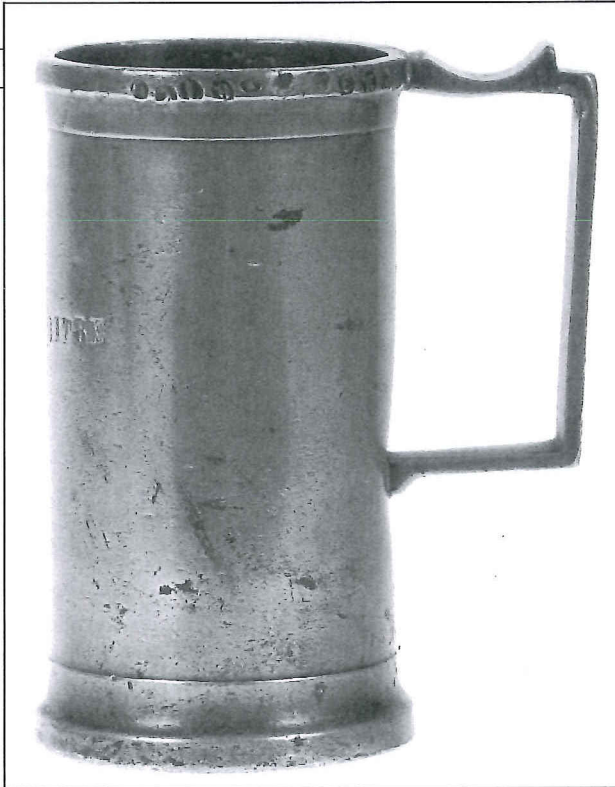
Afb. 1a DEMI LITRE, zonder schenkrand. Gegoten door Bartholomeus Cyprianus Fornara te Geel (1800–1880). Afmetingen: hoogte 8,4 cm; Ø voet 4,8 cm. Langs de bovenrand gemerkt met een kroontje en als eerste ijk \alpha boven 10 (= Mechelen, 1875). Geijkt door Jean Baptiste François Genevais (benoemd bij KOB van 8 juni 1870, Staatsblad van 12 juni 1870). Afgekeurd met RA in een driehoek. Zie ook: Ijking der maten en gewichten gedurende het jaar 1875 , in het Belgisch Staatsblad, 44e jaar, nr. 318 van 14 november 1874, p. 3456. Er is een vergelijkbare maat uit 1872 bekend van LITRE, met de afmetingen: hoogte 17,7 cm; Ø voet 9,7 cm.