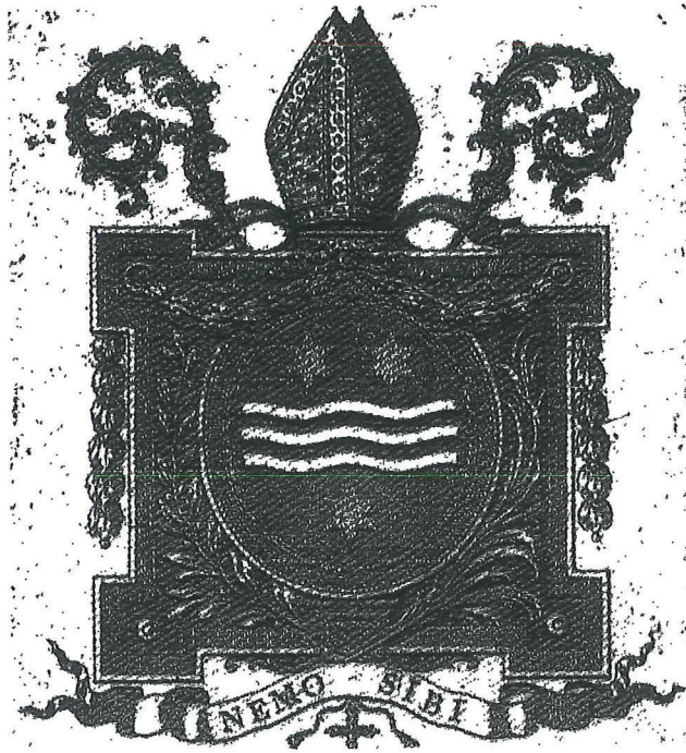
Het wapen van Abt Nicolaus Maras.

Om deze reden heeft dit bescheiden tinnen bord (2), gegoten in Lodewijk-XV-stijl, de verdienste om uit de vergeethoek gehaald te worden. Het bord is gemerkt met het wapen van Nicolaes-Josephus Maras, laatste abt van het Ancien Régime, in functie van 1778 tot 1794 in de Abdij van Grimbergen (3).