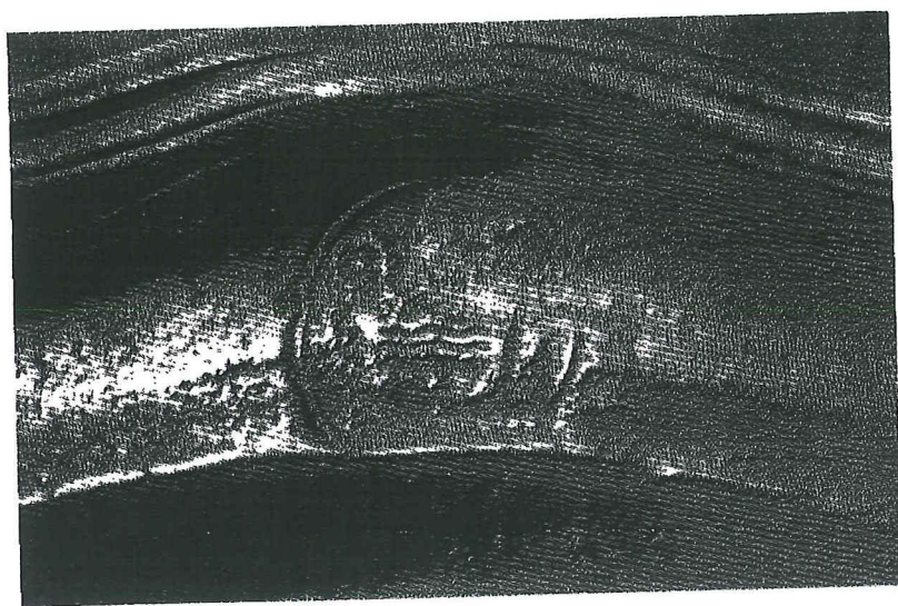
Eigendomsmerk op tinnen bord: wapen van Abt Maras.