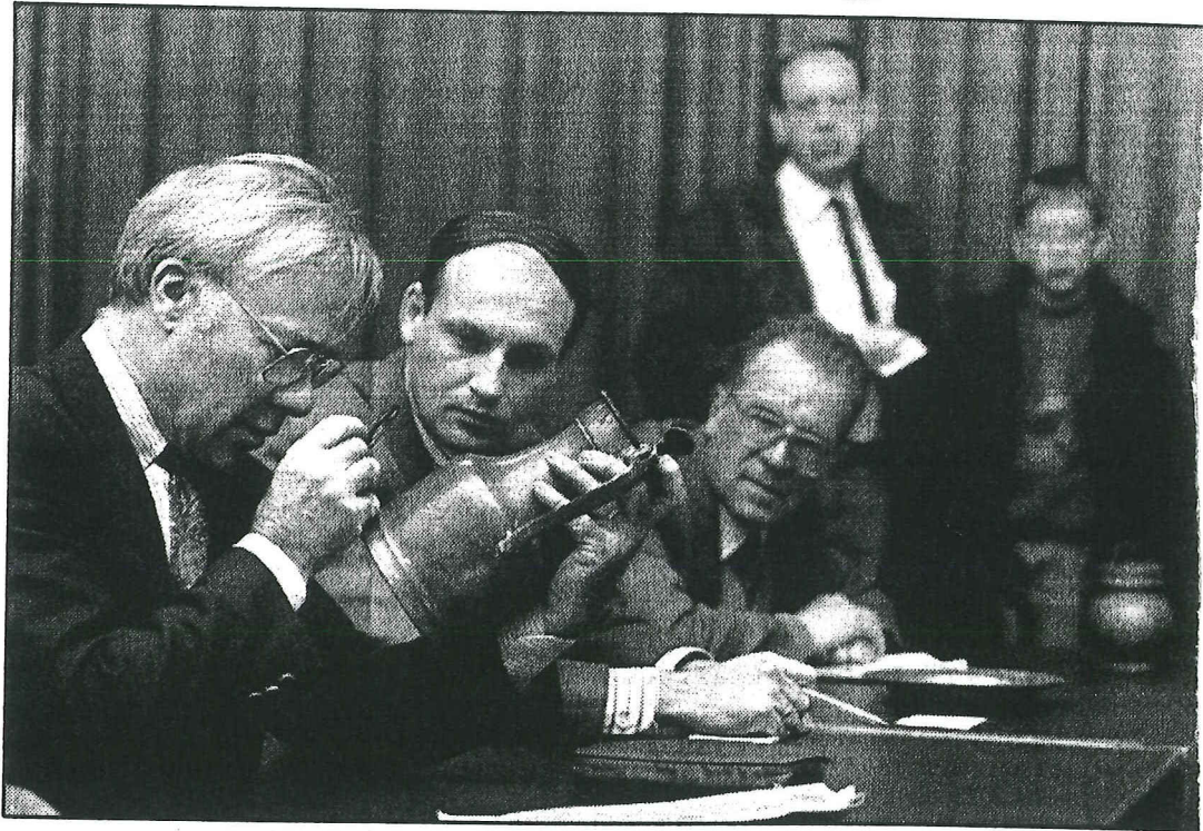
Pottkijkers in het Dendermondse stadhuis ontdekten Dendermonds tin.