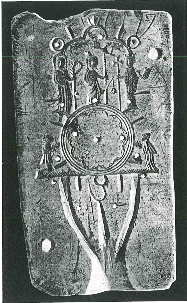
28. GIETVORM IN LEI