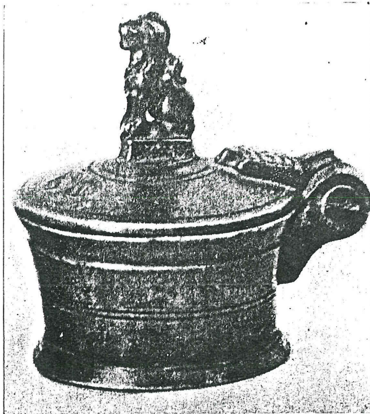
1. Tinnen zoutvat der 15 e E. (Verz. Figdor, Weenen).