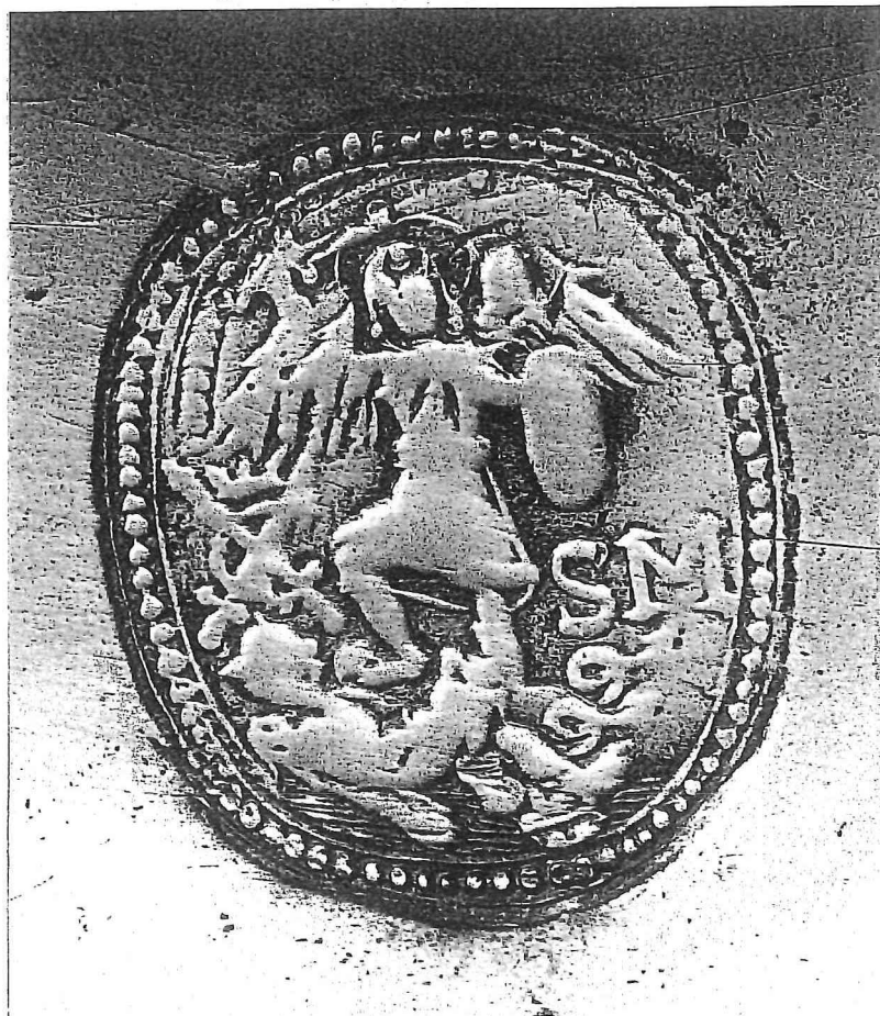
afb 2 Eigendomsmerk van het Gentse St-Michielsgilde.

Niet alleen is dit een prachtige gildeschotel, het is bovendien een uitzonderlijk waardevolle vondst omdat het tot het oudst bewaard gebleven tin behoort dat met naam en toenaam aan een Gentse tinnegieter kan toegewezen worden. Uit de 17de eeuw is er maar bitter weinig Gents tin gekend, laat staan gildetin. Deze kardinaalschotel is dan ook een uiterst zeldzaam voorwerp en een enorm interessante ontdekking voor de liefhebbers en verzamelaars van antiek Gents tin.