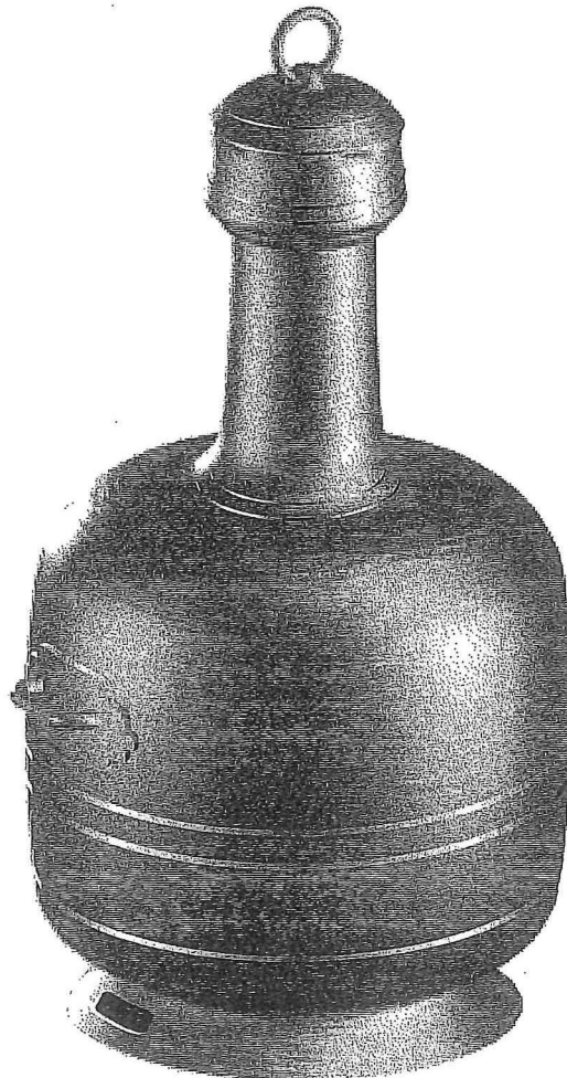
De wijnkoelfles van Eu. Computer - reconstructie.

Het slot, dat reeds in de 19de eeuw door Viollet-le-Duc werd gerestaureerd, is inmiddels eigendom geworden van de stad Eu en krijgt thans opnieuw een grondige restauratiebeurt. Ooit was dit kasteel een van de uitverkoren residenties van de Franse koning Louis-Philippe, die er zelfs tweemaal koningin Victoria van Engeland op bezoek kreeg. Lang niet alle kamers en salons kunnen bezocht worden, maar wat reeds gerestaureerd is loont alleszins de moeite. Het merendeel van wat er te zien is, is in verband te brengen ofwel met de hertogen van Wieze, zoals de immense Galérie des Guise waar nu de bibliotheek van het vroegere Jesuïtencollege is ondergebracht ( \pm 10.000 boekdelen), ofwel met de Franse koning Louis-Philippe. Men bezoekt er o.a. de koninklijke slaapkamer, het eetsalon, de Salle des Gardes en de staatsietrap. Maar het voorwerp uit de koninklijke nalatenschap dat ons het meest nieuwsgierig maakte, was een groot zwaar tinnen vat dat stond opgesteld op een aanrecht, in wat vroeger een afwaskeuken moet geweest zijn. Het had de vorm van een plompe fles met een breed schroefdeksel, bekroond met een ring. We schatten de totale hoogte op zowat 60 cm. Het gewicht stond erbij vermeld: 19 kg !