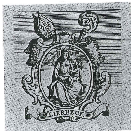
Afb. 2. Eigendomsmerk van de abdij van Vlierbeek (macro 2 ×).

derhalve het tin te situeren in het milieu waarin het eens werd gebruikt. Ze werden gewoonlijk goed zichtbaar op de boord van borden en schotels ingeslagen. Op het bord van J. B. Peeters bevinden ze zich nochtans onder op de bodem. Nog duidelijk leesbaar zijn de initialen IBM, waarvan de naamdrager bezwaarlijk kan achterhaald worden. Een tweede, blijkbaar ouder eigendomsmerk is minder goed leesbaar. De ovale stempel met golvend randlijstje stelt een wapenschild voor tussen twee gekruiste palmtakken en gedekt door een mijter met uitkomende kromstaf; in het schild kan men nog de silhouet onderscheiden van een zittende Madonna met het Kindje op de schoot (afb. 2). Het wapen van de oude Benedictijnenabdij van Vlierbeek bij Leuven, die aan Maria was toegewijd, vertoont reeds van in de middeleeuwen de Madonna met het Kindje gezeten op een bank met in het