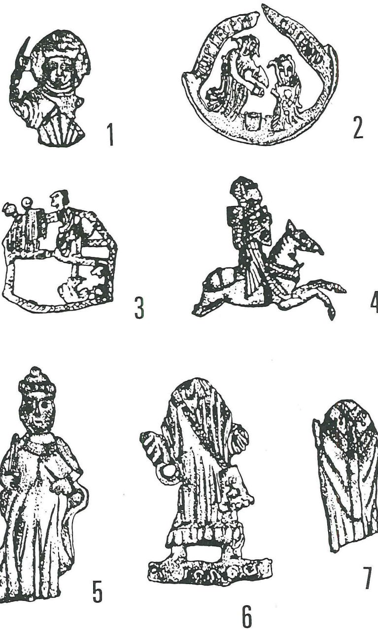
Fig. 1. - Pelgrimstekens te Mechelen gevonden.

Fig. 1, nr. 6: Mannelijke heilige of pelgrim in frontale houding, met afhangend lang kleeid. Hoofd en armen zijn volledig verdwenen. Op de hoogte van de lenden is links één der « ogen » bewaard ter bevestiging.