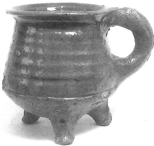
2. Kookkannetje, aardewerk (15de eeuw); bodemvondst Rotterdam, door H.J.E. van Beuningen verworven in 1953. Collectie Van Beuningen-de Vriese, Museum Boijmans Van Beuningen (F 8).

Uit het overzicht van publicaties vallen verschillende dingen te lezen. Allereerst blijkt natuurlijk duidelijk hoe Van Beuningen sinds 1947 continu als verzamelaar en connaisseur in de weer is gebleven. Zijn eerste artikelen heeft hij ongetwijfeld met pen op papier geschreven, vervolgens deden schrijfmachine maar ook secretariële ondersteuning hun intrede. Zijn jongste artikelen componeerde hij eigenhandig achter de tekstverwerker en al snel op de pc. Tenslotte is Van Beuningen in dit magische jaar 2000, waarin hij ook zijn tachtigste verjaardag viert, met volle overgave aan het werk om met behulp van de laatste technologische