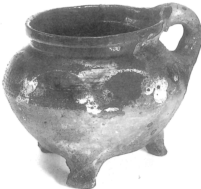
. Kookkannetje, aardewerk met slijbversiering (15de eeuw); bodenvondst Rotterdam, door H.J.E. van Beuningen verworven in 1952. Collectie Van Beuningen-de Vriese, Museum Boijmans Van Beuningen (F 3).

In de hier volgende bibliografie van H.J.E. van Beuningen worden zijn bijdragen opgenomen die inhoudelijk ingaan op historische objecten. De talloze inleidende woorden die hij schreef als 'Woord vooraf', 'Voorwoord' of 'Ten geleide' zijn