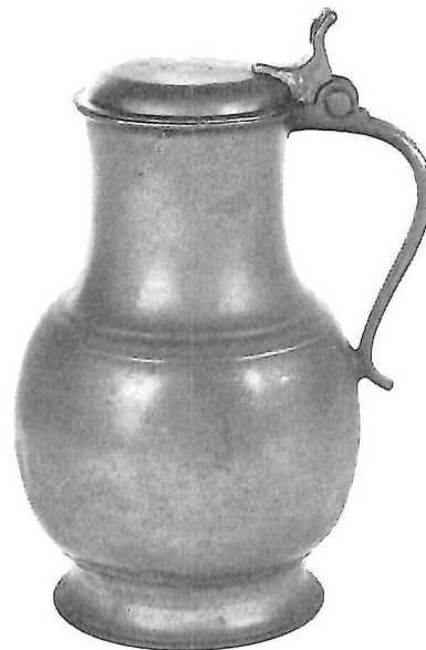
Engelen kan, begin 18e eeuw; hoogte: 28 cm.