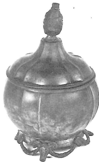
Tabakspot, Louis XV/XVI, gedateerd: 17... hoogte: 19 cm.