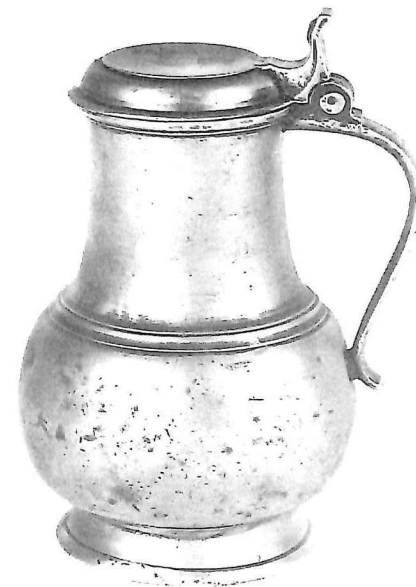
Engelen kan, Luik-Nic. Descampes, midden 18e eeuw, hoogte: 26 cm.