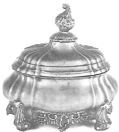
Tabakspot, Louis XV, gedateerd: 1775 hoogte*: 15,5 cm.