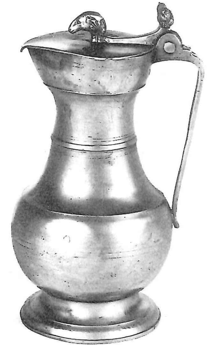
Buikkan, Kanton Wallis-J. Alvazzi, omstreeks 1800, hoogte: 18 cm.