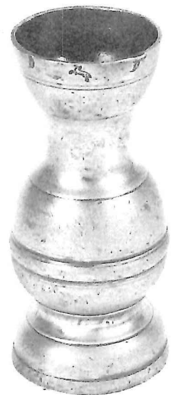
Vloeistofmaat, Hannover, begin 18e eeuw, hoogte: 15 cm.