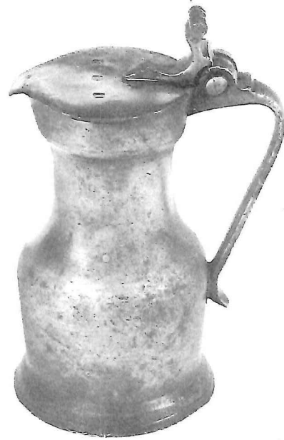
Wijnkan, Paris, Contramerck S.D. 1696-1764, hoogte: 20 cm.