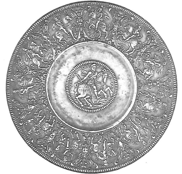
Reliefbordje: medaillon met Ferdinand II, Neurenberg-Georg Schmauss, omstreeks 1630, Ø: 19,5 cm.