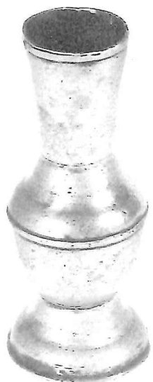
Vloeistofmaat, Hannover, begin 18e eeuw, hoogte: 14 cm.