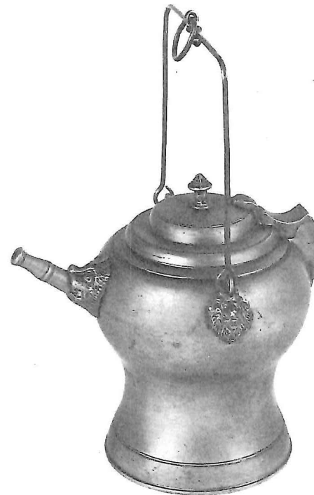
Buikkan met draagketting, Kanton Wallis-Pier Antoin Simaval, midden 18e eeuw, hoogte: 28 cm