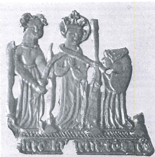
Coll. Van Beuningen, inv. nr. 1423.

erder aangehaalde artikel werd opge- vallend dat de drie eerder tesamen ge- signes welke van een lood-tin alliage van zo matige kwaliteit zijn. Hierdoor dingen en de tekst op de insignes niet tot enbaar. Daarom ook is het verheugend k uit afgevoerde grond afkomstig uit de an Kampen een Sinte Cunera insigne te- vam waarvan de kwaliteit veel beter be- ven is. Zo is de tekst SU(N)T CUNERA sbaar. Ook de topbekroning is, afgezien el aan de rechterzijde, onbeschadigd ge- ellend is het ontbreken van bevestigings- er ook geen aanwijsbare tekenen zijn die t vroeger wél aanwezig zijn. Het insigne thans onder Inv. Nr. 1595 in de collectie en. De afmetingen zijn 65 mm hoog en