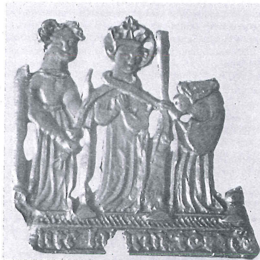
Coll. Van Beuningen, inv. nr. 1423.

35 mm breed terwijl het insigne 12 gram weegt. Cunera stelt ons voor nog meer verrassingen. Uit afgevoerde grond afkomstig uit de bouwput van het bankiershuis Pierson Heldring & Pierson aan het Rokin te Amsterdam werd door een metaaldetectorzoeker een ander, geheel afwijkend Cunera insigne - helaas sterk beschadigd en incompleet - gevonden. Ook dit insigne bevindt zich thans onder Inv. Nr. 1423 in vorengenoemde collectie. Het fragment heeft een hoogte van 43 mm en een breedte van 44 mm. Het is gegoten in een vorm van een alliage van lood en tin. Wederom staat de gekroonde en hier van een nimbus achter het hoofd voorziene Sinte Cunera in het midden. De wurgdoek wordt door de twee vrouwenfiguren ter linker en ter rechter zijde om de hals van de Heilige getrokken. Cunera staat met gevouwen handen.