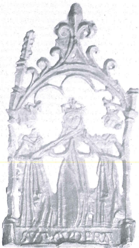
Coll. Van Beuningen, inv. nr. 1595.

Zoals in het eerder aangehaalde artikel werd opgemerkt is het opvallend dat de drie eerder tesamen gepubliceerde insignes welke van een lood-tin alliage gemaakt zijn, van zo matige kwaliteit zijn. Hierdoor zijn de afbeeldingen en de tekst op de insignes niet tot in detail herkenbaar. Daarom ook is het verheugend dat recentelijk uit afgevoerde grond afkomstig uit de binnenstad van Kampen een Sinte Cunera insigne tevoorschijn kwam waarvan de kwaliteit veel beter waard gebleven is. Zo is de tekst SU(N)T CUNERA hier beter leesbaar. Ook de topbekroning is, afgezien van de pinakel aan de rechterzijde, onbeschadigd gebleven. Opvallend is het ontbreken van bevestigingsogen terwijl er ook geen aanwijsbare tekenen zijn die duiden op het vroeger wél aanwezig zijn. Het insigne bevindt zich thans onder Inv. Nr. 1595 in de collectie Van Beuningen. De afmetingen zijn 65 mm hoog en