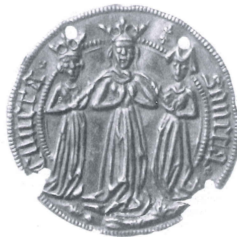
British Museum, inv. nr. 85, 5-6, 106.

Tussen de hoofden van Cunera en dienstmaagd staan twee kleine franse lelies afgebeeld. Het insigne is niet gegoten maar is ontstaan door het persen van de dun-