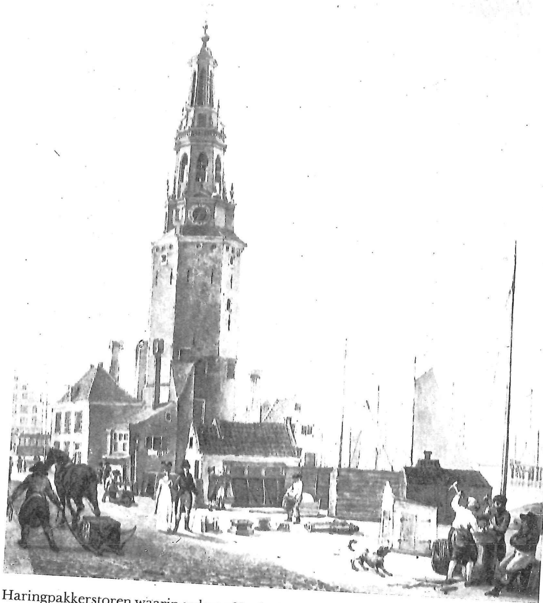
Haringpakkerstoren waarin sedert 1683 de tinnegieters hun gildekamer hadden. Tekening door Reinier Vinkeles, 1801. Historisch topografische atlas, Gemeentelijke Archiefdienst Amsterdam.