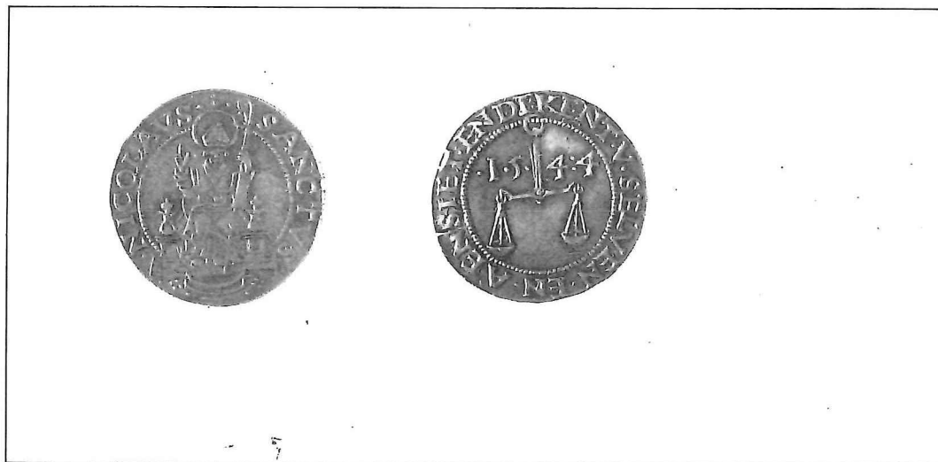
Penning van het ambacht der meerse, recto Sint-Niklaas, verso weegschaal, 1544 ; koper, \varnothing 3,23 Antwerpen, Oudheidkundige musea, Vleeshuis, inv. nr. B 0011

Op 9 maart 1544 richtten de ouderman en de gemene gezellen van het tinnegietersambacht via dekens en oudermans van het Hoofdambacht een brief aan het stadsbestuur om vermindering van het inkomgeld te bekomen (30). Zij beroepen zich op het privilege van 12 november 1523, en vragen de opheffing van de bepalingen nopens het inkomgeld uit de ordonnantie van 7 maart 1543. Uit verdere stukken zullen we wel vernemen, wat er dienaangaande werd beslist. Toch willen we even