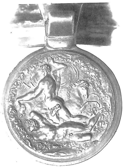
Bolkan in Antwerps plateel door Jan van Bogaert, 1562. Op het tinnen deksel de reliëfvoorstelling van Neptunus de golven bedwingend. Brussel, Koninklijke Musea voor Kunst en Geschiedenis, inv. nr. 5931