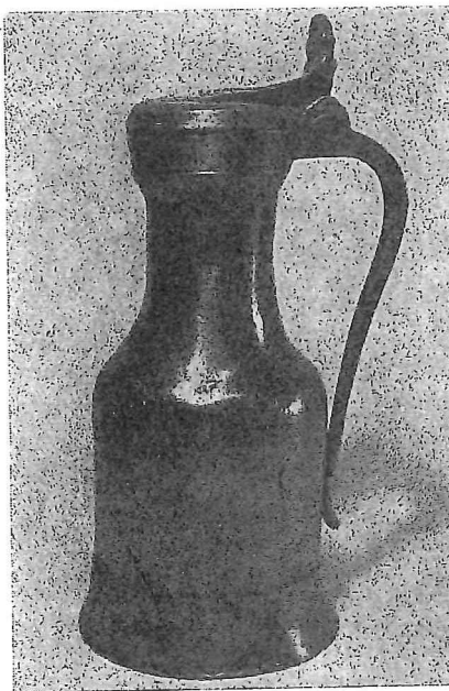
Nederland, eind 16e eeuw

In vitrine 34, 35, 36 kan men het tin om wille van zijn vorm en materiaal bewonderen. De alliage is zodanig, dat de glans levendig is, zonder ooit een harde koude glans te krijgen. Het kannetje op de hoge voet is reeds achttiende eeuws en als Amsterdams werk te beschouwen. De tabakspot met het reliefdecor laat zien, hoe ook hier de renaissance ornamentiek haar intrede heeft gedaan.