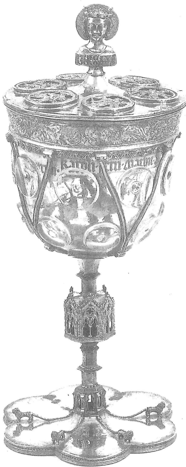
2a. Bokaal met relieken van Karel de Grote; verguld zilver; begin veertiende eeuw. Op het deksel ronde ruiterapplies. Domschat van Halberstadt, inv.nr. 68.