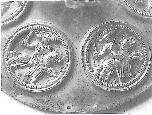
2b. Detail van 2a (foto Fritz 1982, afb. 179).

scala van de heraldiek dat men zich denken kan, inclusief gefantaseerde wapens van al dan niet bestaan hebbende helden uit een meer of minder ver verleden. Het blijkt dat dat nogal eens het geval is bij de kistjes uit de eerste groep.