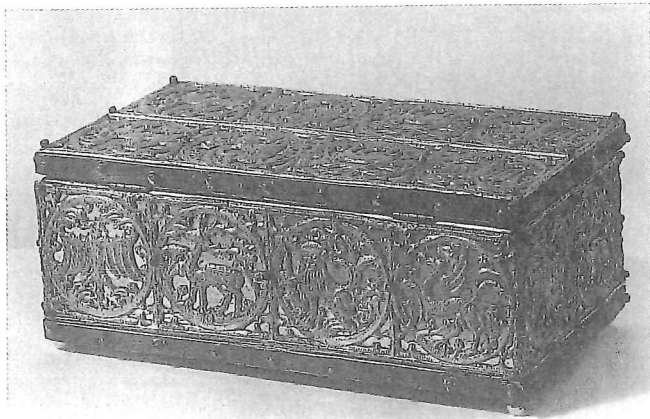
3. Verzilverd houten kistje met ornamenten van verguld tin; veertiende eeuw. Kerkschat van Sint-Servaas, Maastricht.

Wat de techniek van versiering betreft lijkt snijwerk in hout - misschien als opvolger van ivoor - aan de basis te liggen. De vroegste exemplaren zijn ervan voorzien. Later komen gestempeld leer en gegoten metaalbeslag erbij. Geeft het fijne houtsnijwerk, doordat het verguld wordt, aan het voorwerp al een buitengewoon kostbaar aanzien, dit krijgt door de toepassing van verguld tin een dimensie erbij. Dit laatste wordt regelrecht vergeleken met goudsmeedkunst en het vermoeden