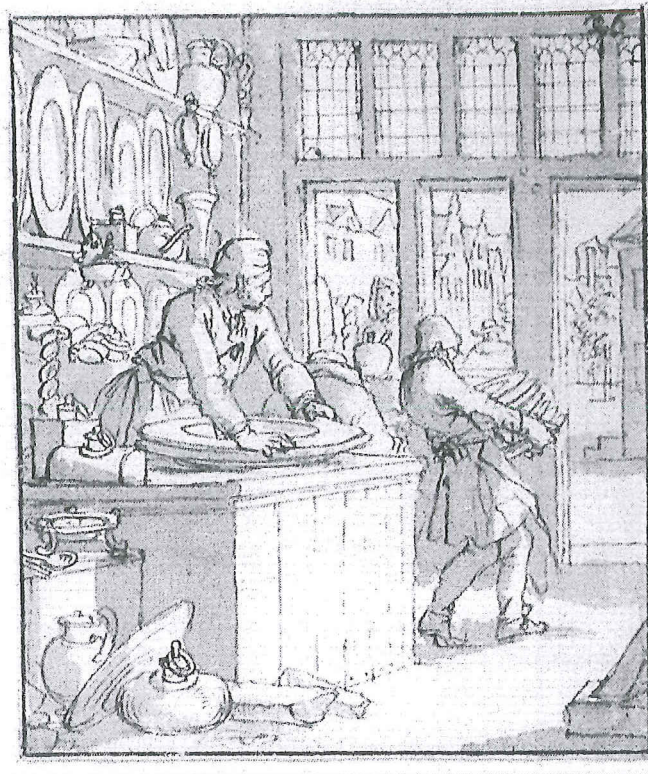
De tinnegieter, boekillustratie van Jan Luyken, 1694