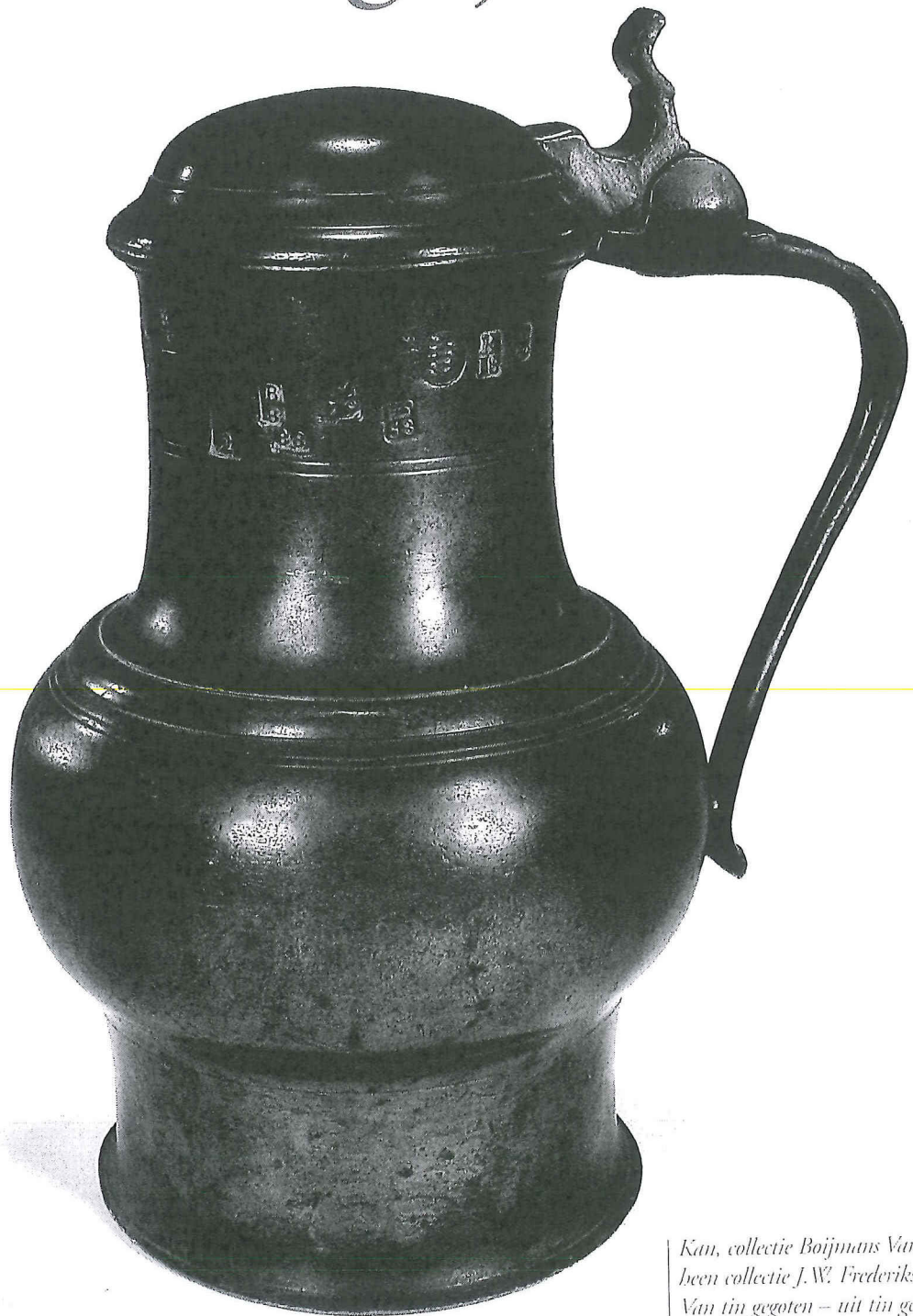
Kan, collectie Boijmans Van Beuningen voorheen collectie J.W. Frederiks (zie catalogus Van tin gegoten – uit tin genoten, blz. 205).