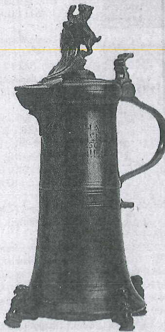
Een tinnen schenkan voor het timmermansgilde; de voorloper van de tap.

In de sectie kunstnijverheid zijn een vijftal niet alledaagse tinnen gilde-schenkkannen te koop in de stand van de Nederlandse kunsthandelaar Jan Beekhuizen. De aanbieder omschrijft de zeldzame attributen zelf als 'de voorlopers van de tap'. De grootste hiervan is een uit 1718 daterende 50 cm hoge schenkan voor het timmermansgilde vervaardigd in Strasbourg die werd gebruikt wanneer een leerling toetrad tot