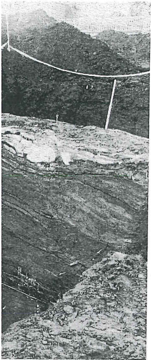
o Archeologische Dienst Am-

iet derde kwart van de 12e uit Noord-Holland van de ; onbekende muntslag van