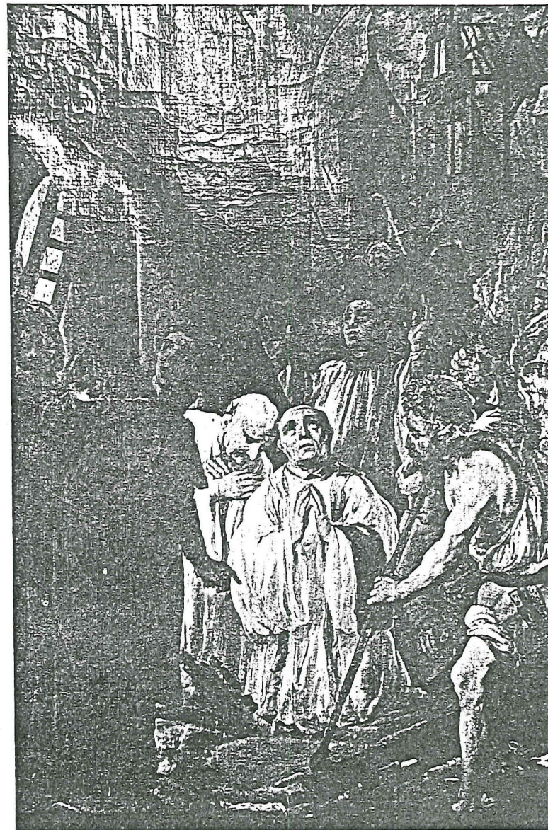
16 De deken van het kapittel te Dordrecht vindt het heilig Hout tussen de puinhopen van de verbrande kerk (1457). Schilderij in de O.L.V.-kerk te Brugge (17e eeuw).

De deken heeft op een dramatisch moment gebruik gemaakt van de situatie en met grote tegenwoordigheid van geest de gang van zaken geregisseerd. Wij kunnen niet meer achterhalen wat er precies gebeurd is, maar als er sprake is geweest van een vooropgezette inscenering van het mirakel dan werden door de handelwijze van de deken alle aanwezigen, al dan niet bewust, tot medeplichtigen. Dat er ruimte was voor twijfel blijkt wel uit het commentaar van kardinaal Aeneas Sylvius Piccolomini, die Dordrecht kort na de brand bezocht en