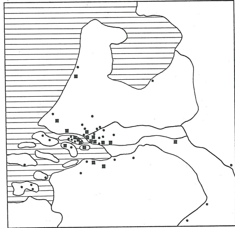
Plaatsen van herkomst der bedevaartgangers volgens het mirakelboek van het heilig Hout. Buiten de kaart vallen Danzig, Diest en Luik, elk met één wonder.

Over Dordrecht zijn meer gegevens beschikbaar. De Brugse commissie beweerde: 'Uit de inkomsten van de votiegaven is de hele kerk van de heilige Maagd herbouwd, die toch totaal verbrand was'. 59 Dit was echter enigszins overdreven, want de kerkmeesters hebben ook andere bronnen aangeboord ter financiering van de wederopbouw. Zo verwierf de kerk van stadswegen het recht van exue, dat wil zeggen