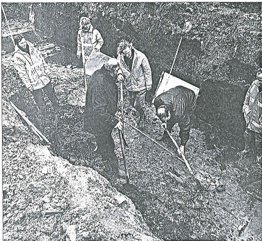
Tijdens de voorbereidende werkzaamheden voor het ontwikkelen van een bouwplan is tegenover de arbeiderswoningen aan de Hooisteeg een archeologisch onderzoek uitgevoerd door het bureau BAAC bv te 's-Hertogenbosch. Deze opgraving bevestigde de aanwezigheid van het vroegere slagenlandschap en bracht enkele vondsten aan het licht.