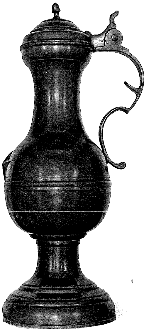
Wandtapijt 'De prins van Arglistigheid' (circa 1480). Collectie Dumbarton Oaks, Washington.

Er moeten zeer veel stadskannen bestaan hebben, elke zichzelf respecterende vrije stad beschikte erover. In de Lage Landen zijn er 81 overgeleverd, verspreid over zeventien steden. Het aantal per stad varieert tussen één en vier, uitzonderingen zijn Oudenaarde, met twaalf kannen, en Maastricht, met achttien. Uitzonderlijk zijn de vier kannen van Enkhuizen, die een stadswapen hebben, maar een houten kern bevatten. Waarschijnlijk waren het pronk- in plaats van stadskannen, voor op de gevel van het stadhuis.