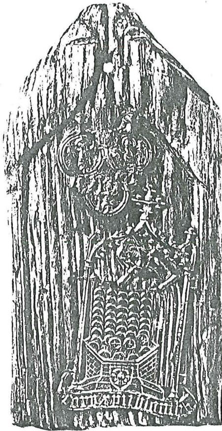
Afb. 4. Plankje met twee pelgrimstekens, gevonden te Amsterdam. Boven het insigne van Wilsnack, onder dat van Blomberg. Amsterdams Historisch Museum.