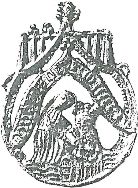
Afb. 3. Amersfoortse pelgrimsteken, 'Amsterdams' type, gevonden in Amsterdam bij de aanleg van de oostlijn van de metro. Amsterdams Historisch Museum.