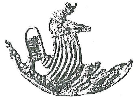
Afb. 5. Fragment van een waarschijnlijk Amersfoortse pelgrimsteken, gevonden te Amsterdam bij de aanleg van de oostlijn van de metro. Amsterdams Historisch Museum; foto AHM/PW-Afd. Archeologie, evenals afb. 3 en 4.

Vóór haar water, achter haar, anders dan op de andere tekens, een emmer, die ook weer meer overeenkomst vertoont met de voorstelling op het insigne van Boymans-Van Beuningen dan met die van het 'Amsterdamse' type.