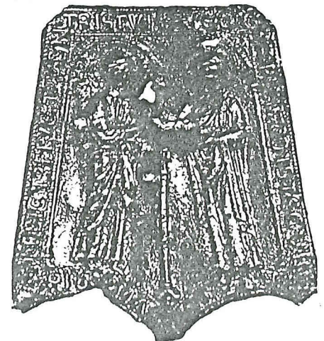
Afb. 17 Pelgrimsinsigne uit Nazareth. Hoogte 4,9 cm.