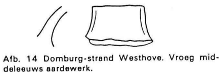
Afb. 14 Domburg-strand Westhove. Vroeg middeleeuws aardewerk.