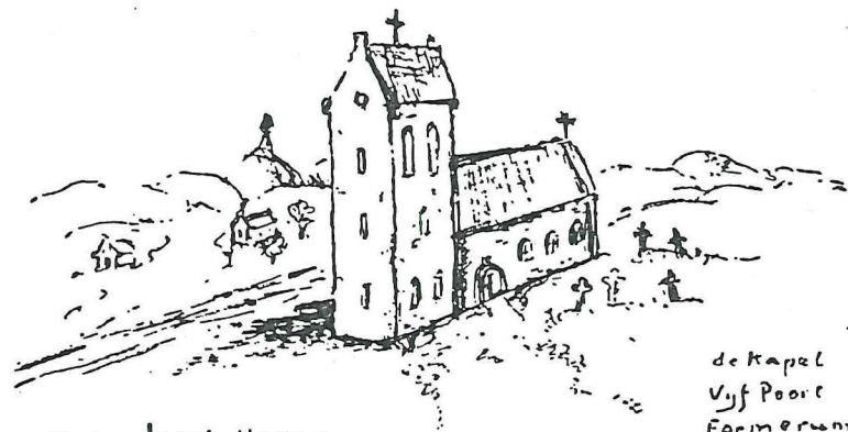
naar Jacob Heeres 1556