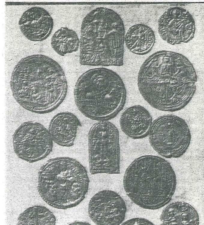
Een deel van de collectie pelgrimsinsignes uit het getijdenboek

Uit het verdronken land van Zeeland komen nog steeds metalen pelgrimsinsignes te voorschijn, die door de hermetische afsluiting van zuurstof in de fijne, vette en natte klei goed geconserveerd bleven.