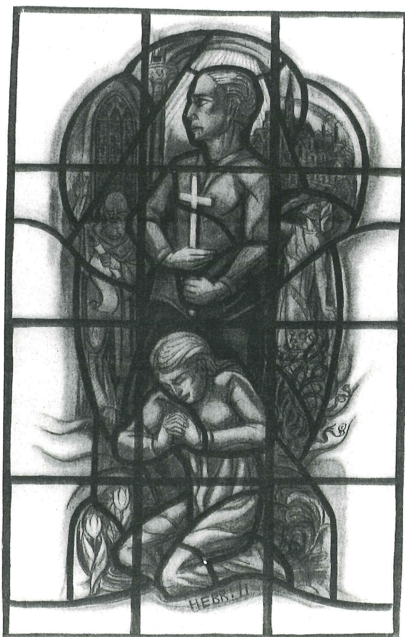
J.H.E. Schilling, ontwerptekening voor raam remonstrantse kerk te Arnhem, 1942. RMCC te 143a.