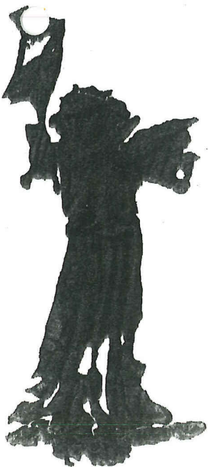
Pelgrimstekens met de H. Michael, Thomas Becket (?) en een Calvarie, en een ampul. Tin-lood legering, 15de eeuw. resp. RMCC m 299, 300, 301 en 302.

De vier verworven pelgrimstekens dateren alle uit de 15de eeuw. Het insigne van St. Michael is uniek in zijn soort. Het bestaat uit drie verschillende delen (onderlijf, bovenlijf en vleugel), die door middel van een soort klinknageltje aan elkaar gezet zijn. Het insigne is met een lengte van 13,2 cm. een van de grootste die er bekend zijn. Er zijn wel fragmenten (vleugels) gevonden van soortgelijke insignes in Engeland (3), maar geen complete engel zoals deze. Het St. Michaelsinsigne is opgegraven in Nieuwlande, een middeleeuwse dorp in het verdrinken land van Zuid-Beveland. Over de oorspronkelijke herkomst van dit insigne weten we niet zoveel. Behalve in