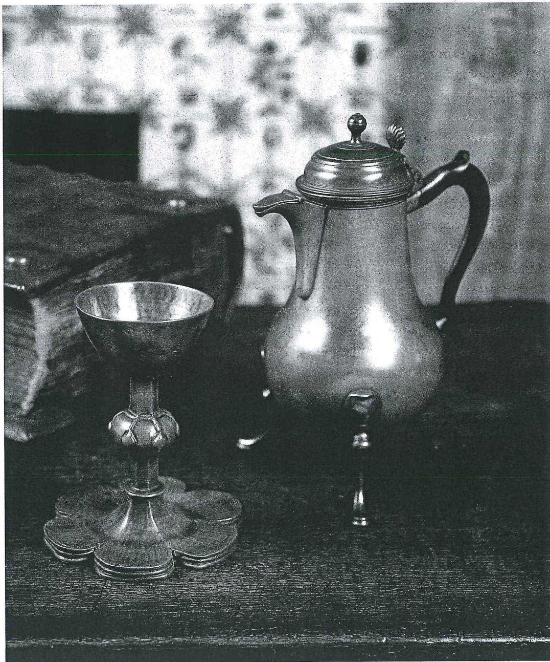
A CHALICE AND A COFFEE POT TWO HIGHLIGHTS OF THE PEWTER COLLECTION OF FRITS PHILIPS SR.