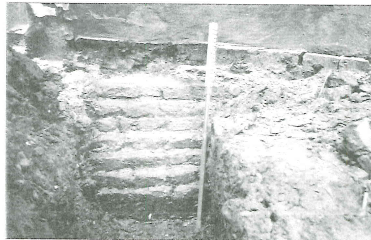
Het fundament van de stenen kamer.