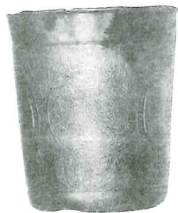
De tinnen beker