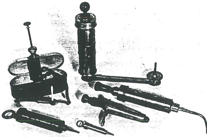
Collectie klisterspuiten, w.o. een zgn. "Soi-même" (een doe het zelf klisterspuit). Rechts op de voorgrond een speculum, Frankrijk 19e eeuw.