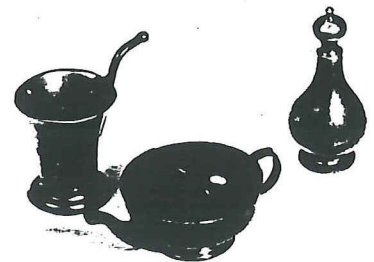
V.l.n.r.: zuigbekertje, Nederland 1750; ziekenbekertje, Frankrijk 1800 en een zuigflesje, Frankrijk omstr. 1800.