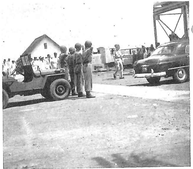
Z. K. H. vertrekt onder het wakend oog van de wacht.