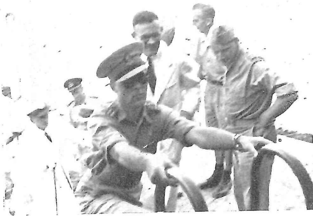
Z. K. H. beklint de 9-W.