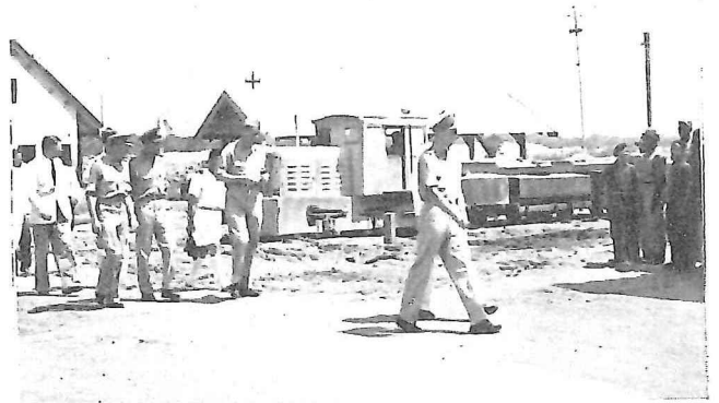
Z. K. H. vertrekt.