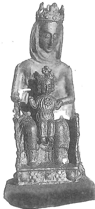
1. Tinnen Sedes Sapientiae. Bodemvondst Nieuwlande (1986). H. 89 × br. 34 × d. 26 mm; datering ca. 1300. Particuliere collectie.

Zoals hierboven reeds vermeld, werd het in Salisbury gevonden exemplaar gedateerd in de eerste helft van de veertiende eeuw. In een latere publicatie wordt als datering laat dertiende of vroeg veertiende eeuw genoemd. 3 Gezien de hierna vermelde redenen, lijkt deze laatste datering terecht. Een datering 1250-1350 voor de hele groep,