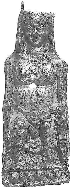
3. Tinnen Sedes Sapientiae. Bodemvondst Amsterdam (1998). H. 83 × br. 30 × d. 26 mm; datering ca. 1300. Particuliere collectie.

derhalve een wat ruimere periode, is aan te bevelen. Dit temeer daar enkele exemplaren vroege en andere wat latere kenmerken hebben. In het bijzonder geldt dit voor de plaats van het Kind op de moederschoot, strikt frontaal of op de linkerknie. Tijdens de Romaanse periode van de westerse beeldhouwkunst wordt Maria veelal voorgesteld als Sedes Sapientiae of Zetel (Troon) der Wijsheid, waarbij Maria in streng frontale houding gezeten is en het Jezuskind eveneens in frontale houding op haar schoot zit. Opvallend hierbij is het hieratische karakter. Meestal heft het Kind de rechterhand op in een zegengebaar en houdt het in de linker een boek of de wereldbol.