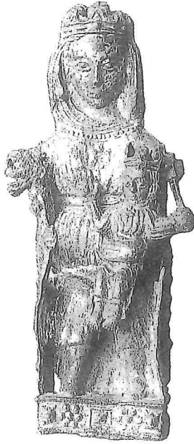
2. Tinnen Sedes Sapientiae. Bodemvondst Dordrecht (1991). H. 82 × br. 26 × d. 26 mm; datering ca. 1300. Collectie H.J.E. van Beuningen, Cothen.