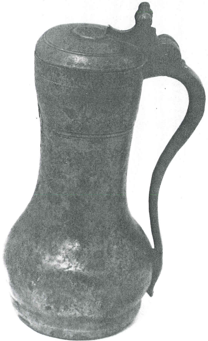
Afb. 1. Tinnen kan, 15e eeuw. H. 24 cm.

Hoewel niet bewijsbaar is dat de kan en de steekwapens tezamen bij dezelfde gelegenheid verloren zijn, is de