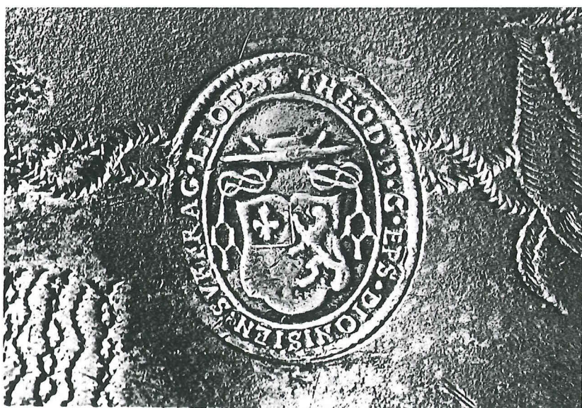
Afb. 2. Zegelstempel van hulpbisschop Th. de Grace (†1636), (macro 2 x).

Uit het huisraad van Thierry de Grace kon tot nog toe alleen de tinnen schotel achterhaald worden die nog tijdens het leven van tinnegieter Adriaenssens in Luik terecht kwam. Toen deze schotel in het bezit van de Luikse suffragaan was, droeg hij nog geen gegraveerd décor. Pas nadien werd met de burijn op de boord en in het plat een versiering uitgestoken in zigzagsteek, ook trembleer- of dribbelsteek genoemd. Over de boord loopt een gevlochten ketting, die drie ronde medaillons en een wapenschild verbindt. Twee medaillons, omgeven met een stralenkrans, dragen respectievelijk de bekruste namen van MARIA en ANNA. In het derde medaillon werd het Christusmonogram IHS gegraveerd, bekrond met een kruisje en met drie nagels eronder. Tussen deze medaillons en het wapenschild, dat door twee leeuwen wordt gehouden, is telkens een dier voorgesteld. Op het eerste gezicht lijkt het een hinde te zijn die een bloemstengel in de bek houdt. Bij nader toezien echter dragen de twee dieren, die het Christusmonogram flankeren, respectievelijk een kruis en een gewei met kruis tussen de horens, zodat zij moeten beschouwd worden als het Lam Gods en als het hert in wiens gewei de Gekruisigde aan de heilige Hubertus verscheen. Het dier naast het Mariamedaillon draagt één lange, rechte hoorn op het voorhoofd en stelt de fabelachtige eenhoorn voor, zinnebeeld van de kuisheid. Deze symbolische dieren lichten dus zinvol de medaillons toe waarbij zij geplaatst werden.