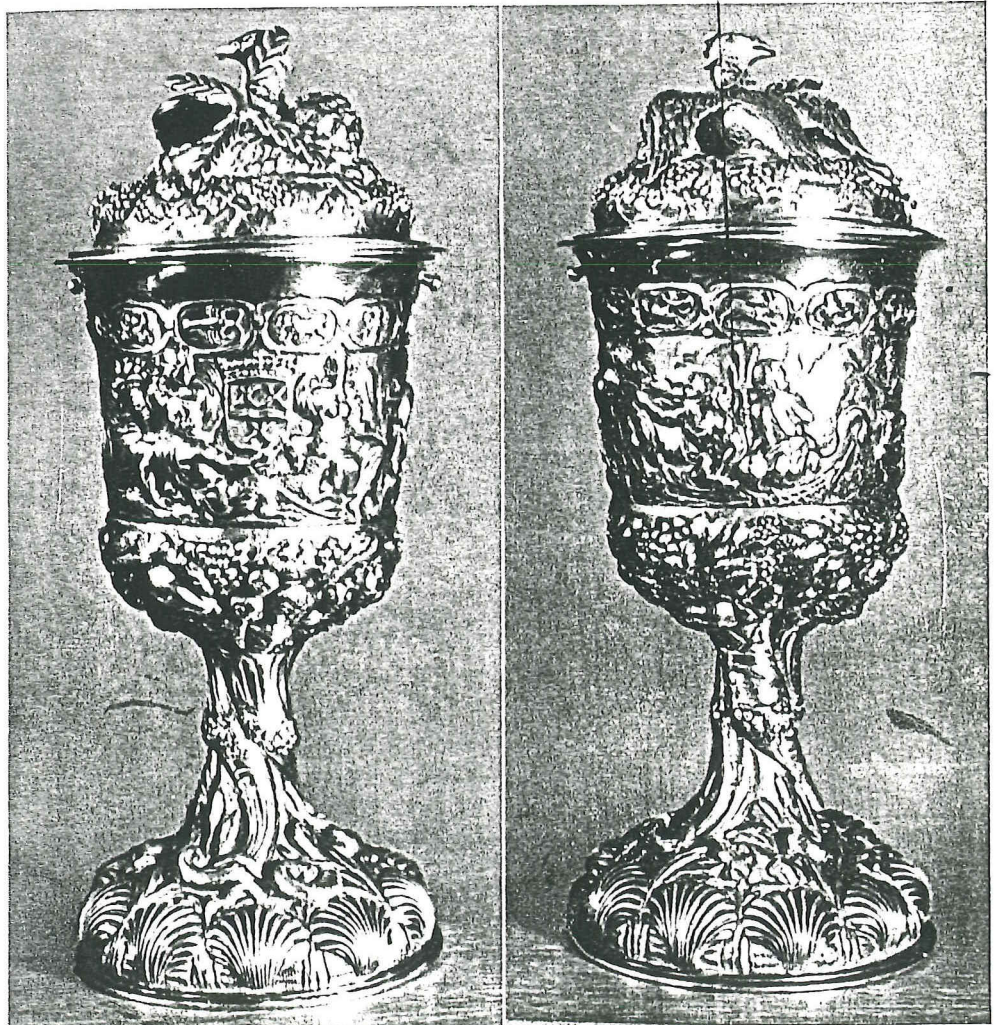
Hens kroes van de Ambachtsheerlijkheid Cromstrijen.

Voor abonnementen en advertenties: Uitgeversbedrijf Reflex, Rotterdam, Mathenesserlaan 310, Telefoon 35570, Giro 271500